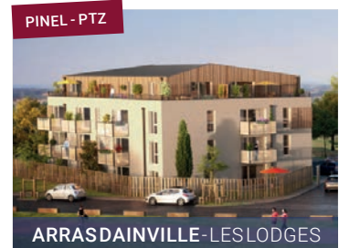
PINEL - PTZ