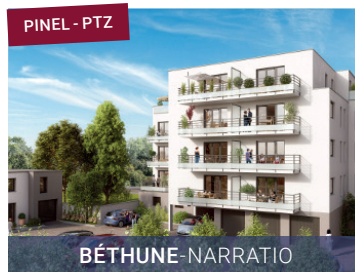
PINEL - PTZ