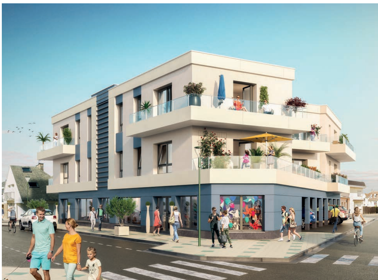
Villa Castille - Edim Immobilier - Perspective Vertex

De la frontière belge à Berck-sur-Mer aux abords de la baie de Somme, le littoral offre pléthore de paysages, dont certains sont à couper le souffle. Entre terre et mer, la côte d'Opale est une succession de longues plages, dunes, marais et sentiers battus. Ainsi, dans chacun des territoires, la nature se façonne autant qu'elle se contemple, tantôt sauvage, tantôt accueillante ou paisible. À la simple évocation de cette région côtière, l'envie immédiate de s'évader tout près de chez soi pour se reconnecter à la nature, s'essayer aux sports de vent ou faire le plein de sensations. Ce souffle d'air pur et d'aventures, cumulé à un cadre de vie idyllique et à proximité des grandes villes, ne manque pas d'attirer les investisseurs et acquéreurs en quête de résidence secondaire. La majorité d'entre eux proviennent de la métropole lilloise, d'Amiens, d'Arras, de Paris, grâce à la gare d'Étaples mais aussi de Belgique. Pour le promoteur Sigla Neuf, par exemple, les belges représentent 50% de la clientèle.