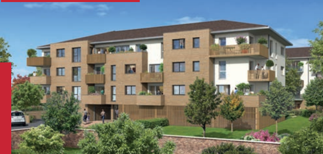
LE CLOS DES ORMES