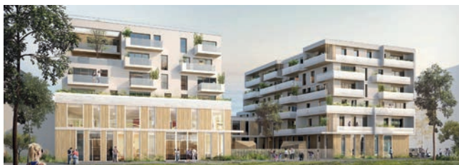
NOUVEL AMÉNAGEMENT URBAIN

COMINES LES JARDINS DE SAINT-CHRYSOLE CELLULES COMMERCIALES EN REZ DE CHAUSSÉE À PARTIR DE 123 500 €