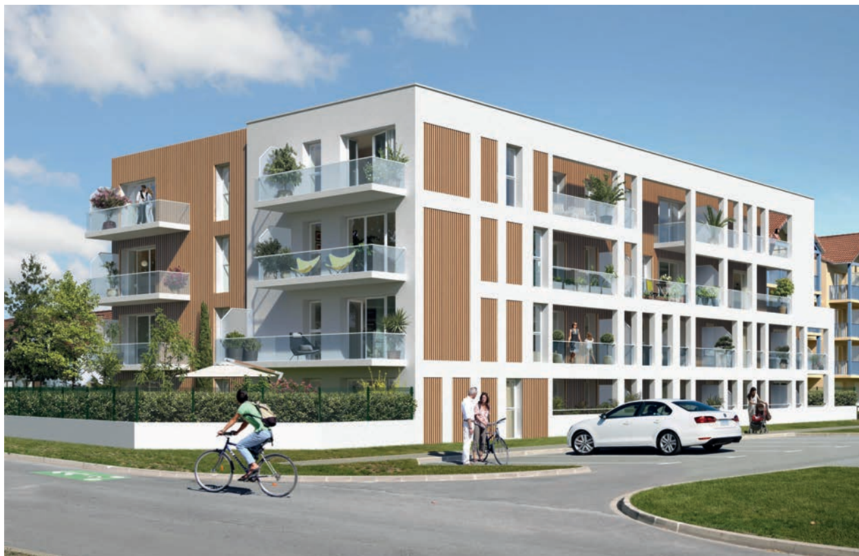
Les Grandes Marées - Édouard Denis