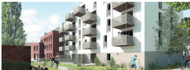
CADRE DE VIE EXCEPTIONNEL

COMINES LES JARDINS DE SAINT-CHRYSOLE LOCATION ACCESSION - APPARTEMENTS À PARTIR DE 113 000 €