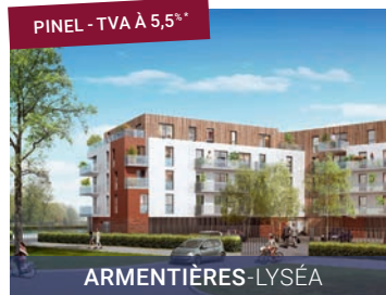
PINEL - TVA À 5,5%*

Appartements de 3 à 4 pièces avec jardin ou terrasse. Au cœur de La Croix Saint-Ouen. Environnement exceptionnel.