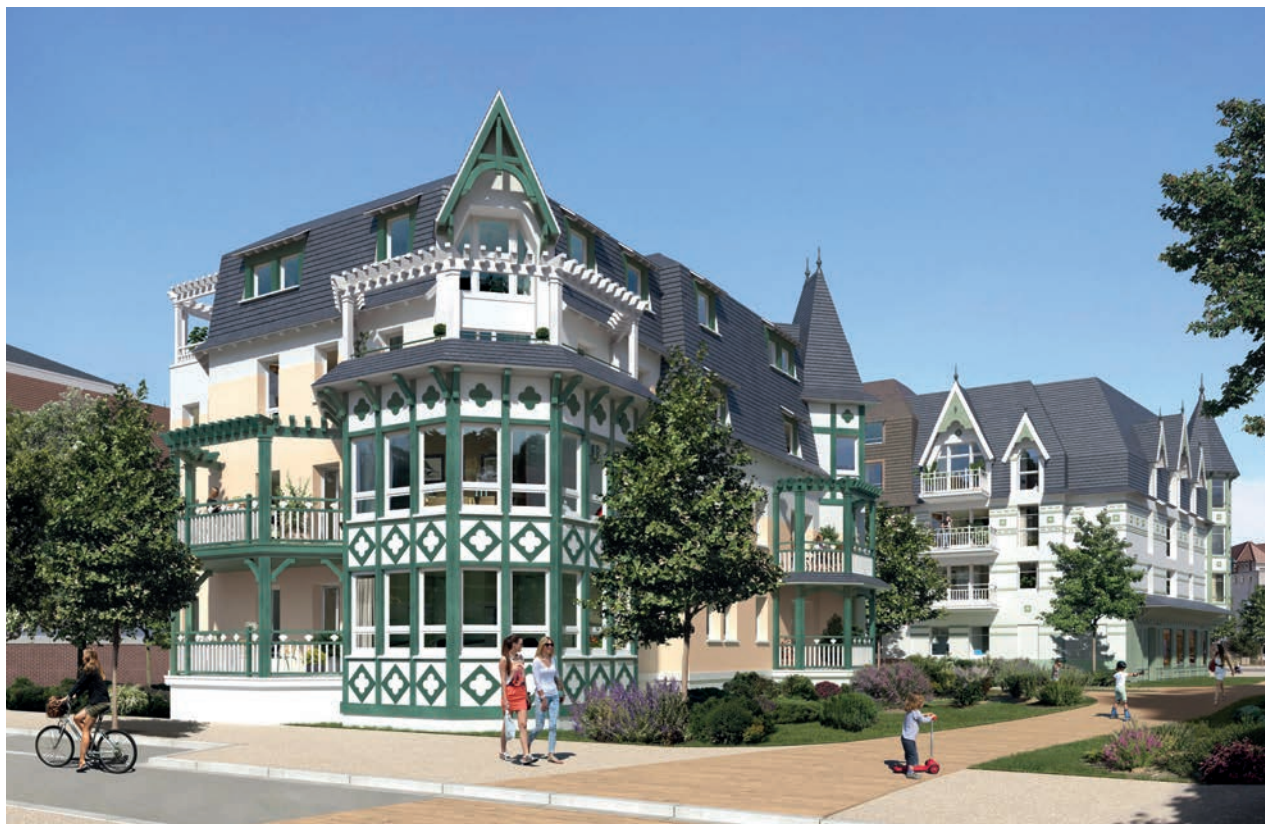
Quentovic - Édouard Denis & Sigla Neuf

Le quartier le plus prisé est le Triangle d'or ! Suivi du quartier de Quentovic, un peu moins cher, puis du quartier de l'Atlantique où toutes les maisons sont à proximité immédiate de la plage. »