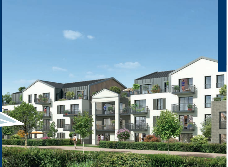
LES TERRASSES DU PARC