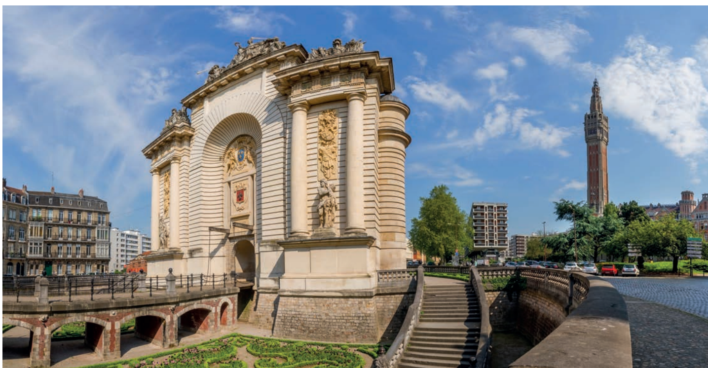
Le PLU2 cherche à mettre à l'abri ses ressources agricoles en préservant des zones de cultures, favorisant ainsi une production proche des consommateurs.

À consulter sans modération pour savoir où investir, où et comment construire... ou pour simplement imaginer son environnement futur (transport, immeuble, magasin, parc).