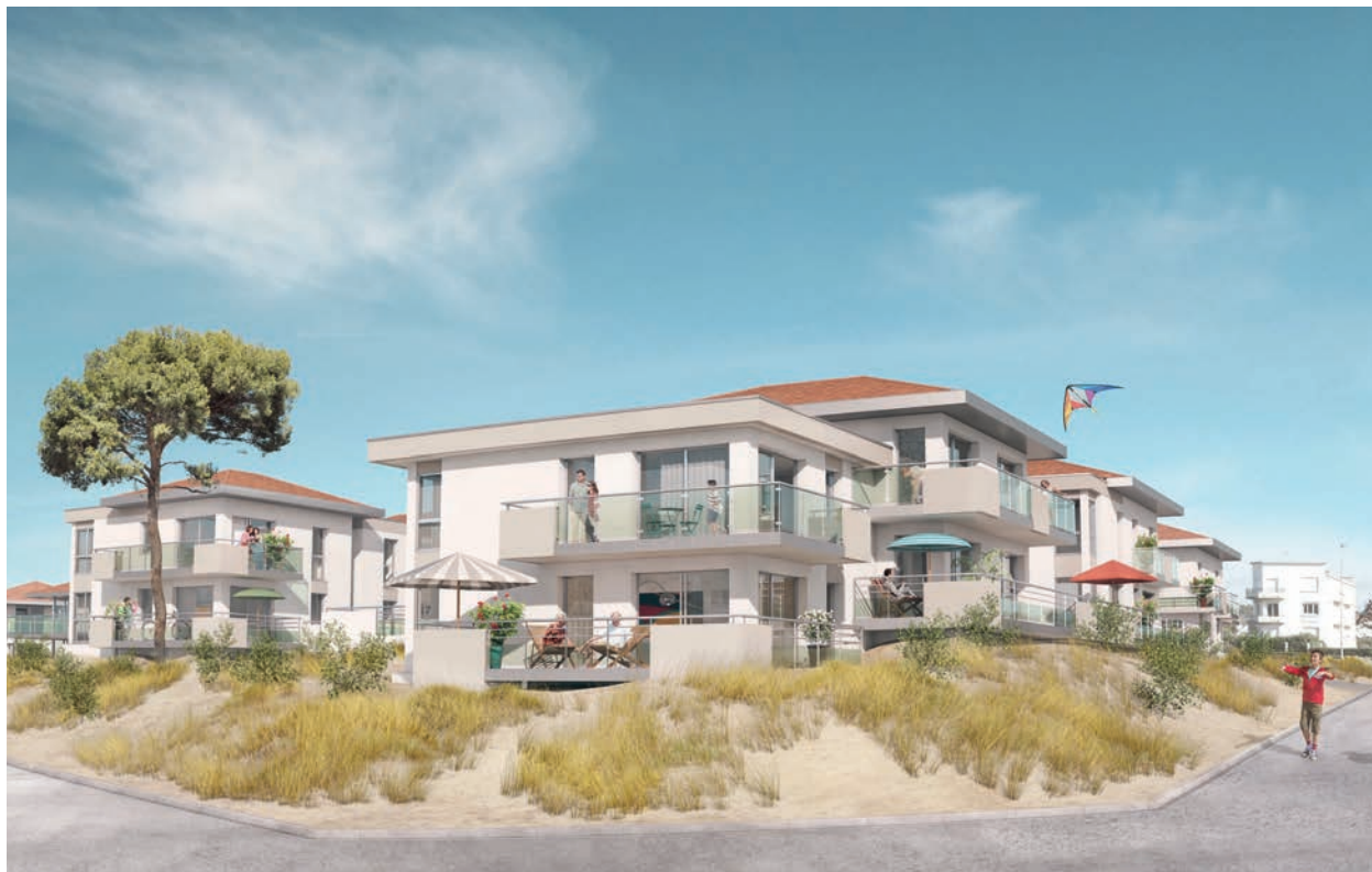
Les Pléiades - Sigla Neuf

Du studio à la maison individuelle, le marché offre des biens pour tous les goûts et budgets. « C'est aussi le retour des primo-accédants qui profitent de la conjoncture du marché pour fuir les grandes agglomérations et avoir un pied-à-terre sur la côte. » Les bénéficiaires d'une vie au vert semblent d'ailleurs séduire un Français sur trois, selon une étude du promoteur Capelli.