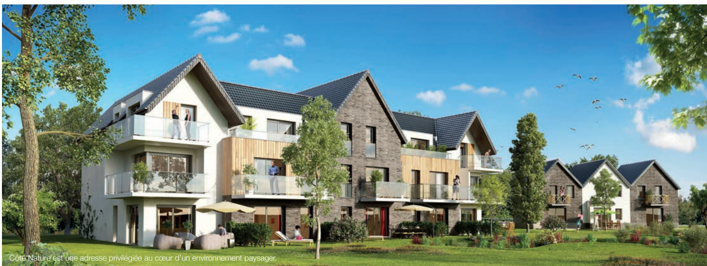
Côté Nature est une adresse privilégiée au cœur d'un environnement paysager.